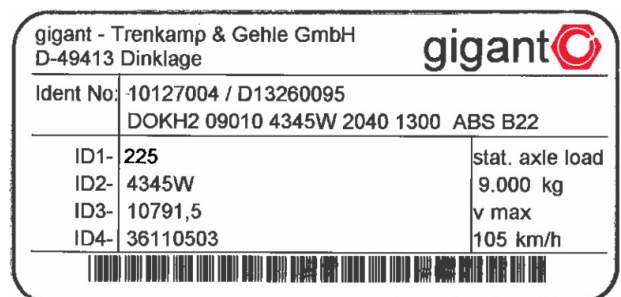
Abbildung 2: Typenschild ab 09'2013

Zum Umfang der neuen Prüfprotokolle gehören nun auch sogenannte „information documents“. Inhalt sind für den technischen Dienst relevante Daten zur Achse, zur Bremse sowie die zulässigen Abstände zwischen Bremse und Rädern.